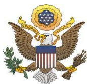
Ambasciata degli Stati Uniti d'America in Italia